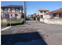
前面道路含む現地写真 前面棟なし、玄関目の前が公園です。