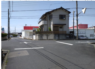
前面道路含む現地写真 大通りに近いですが日中の交通量は1、2分に1台程度です。2025年4