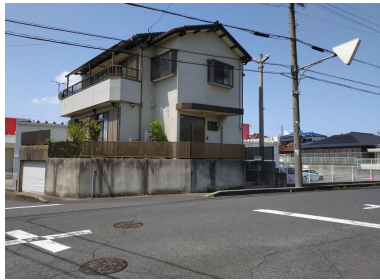
現地土地写真 建物をご契約後に売主にて解体更地してお渡します。2025年4月14日撮影