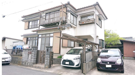
現地土地写真 既存建物は解体して更地渡し。 建築条件はありません。