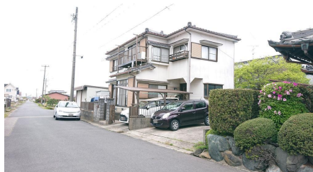
前面道路含む現地写真 既存建物は解体して更地渡し。

区画图 南向き、やや横長の地形です。高低差はありません。土地価格1250万円、土地面積120㎡