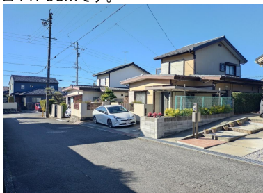
前面道路含む現地写真 2024年1月5日撮影 前面道路の道幅は6m。