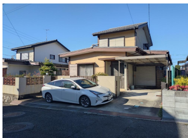
現地土地写真 2024年1月5日撮影 間口11.95mです。